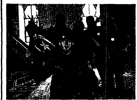
القوات الصريهة تدخل يلدة «بيجلجينا» الإسلامية ونقد السورة علم إسلامي قامت القوات الصويية بتمزيقه