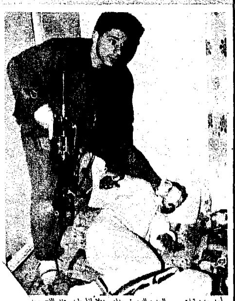
يتم تحليم سعتويات المنزل واهانة جسيع الموجردين قبل أخذ الشاب