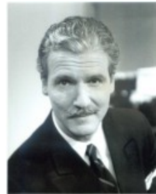
.5 مستشار سابق في وزارة الدفاع Robert R. Reilly

-- هناك الكثير والكثير.. لكن نكتفي بهذا القدر!