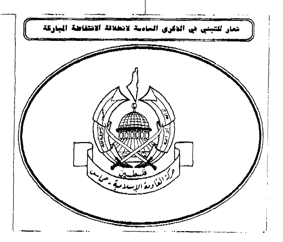
والحمطلت رب العالمين ...

وحبذا لو رجع الأغوة الى المقالات الواردة في الإرسالية الأسبوعية المتعلقة في ماهية الحكم الذاتي الاداري وأخطاره وتمت مدارستها فيما بيثهم .